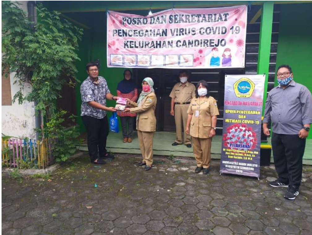
Gambar 2. Kegiatan Pengabdian Masyarakat